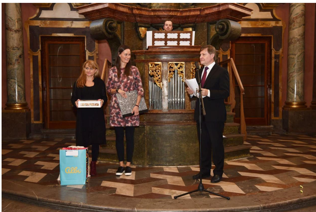
Obrázek 7 – Regionální knihovna Karviná