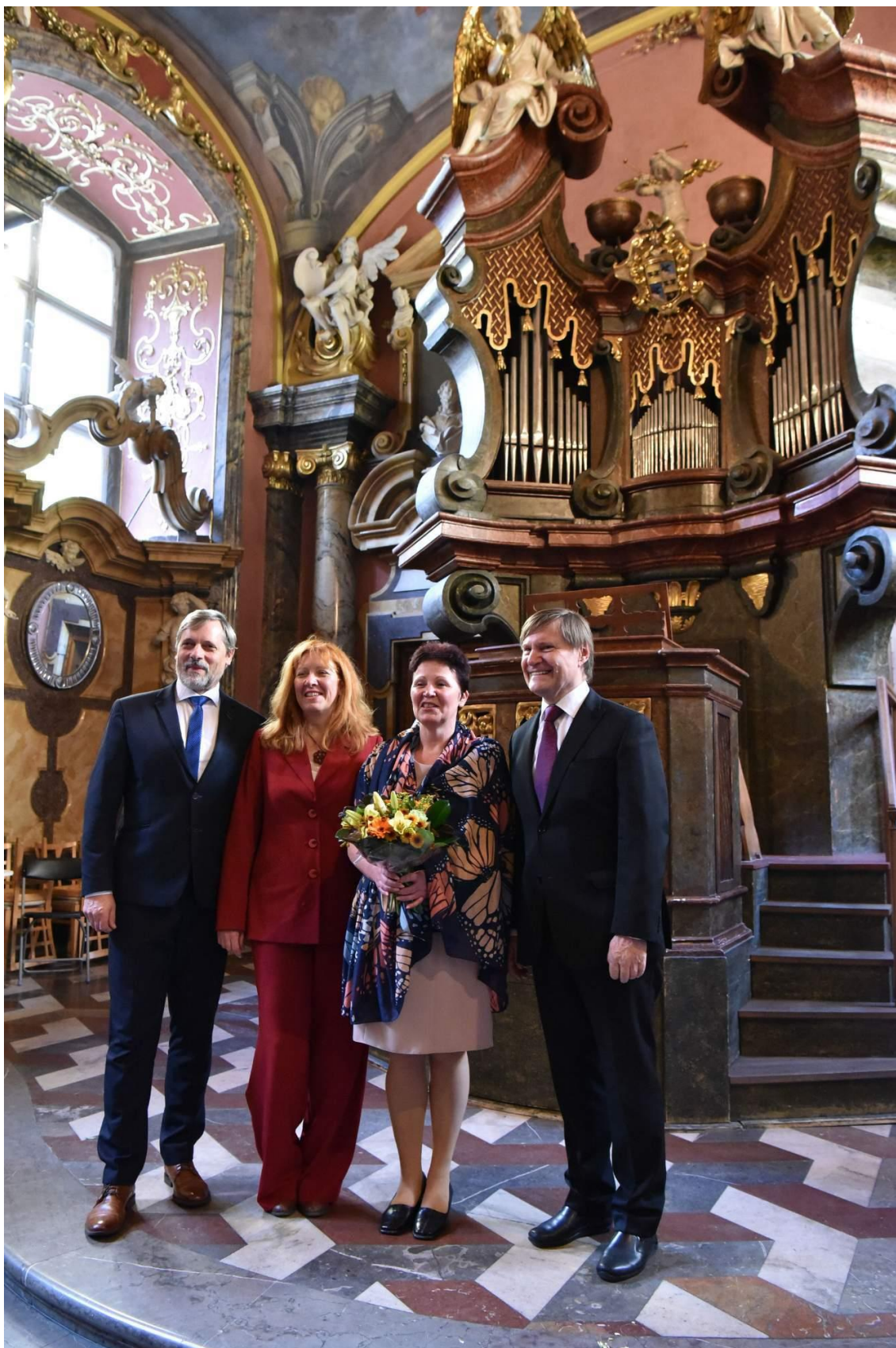
Obrázek 5 – Knihovna roku 2018 – MK P. Křížkovského Holasovice