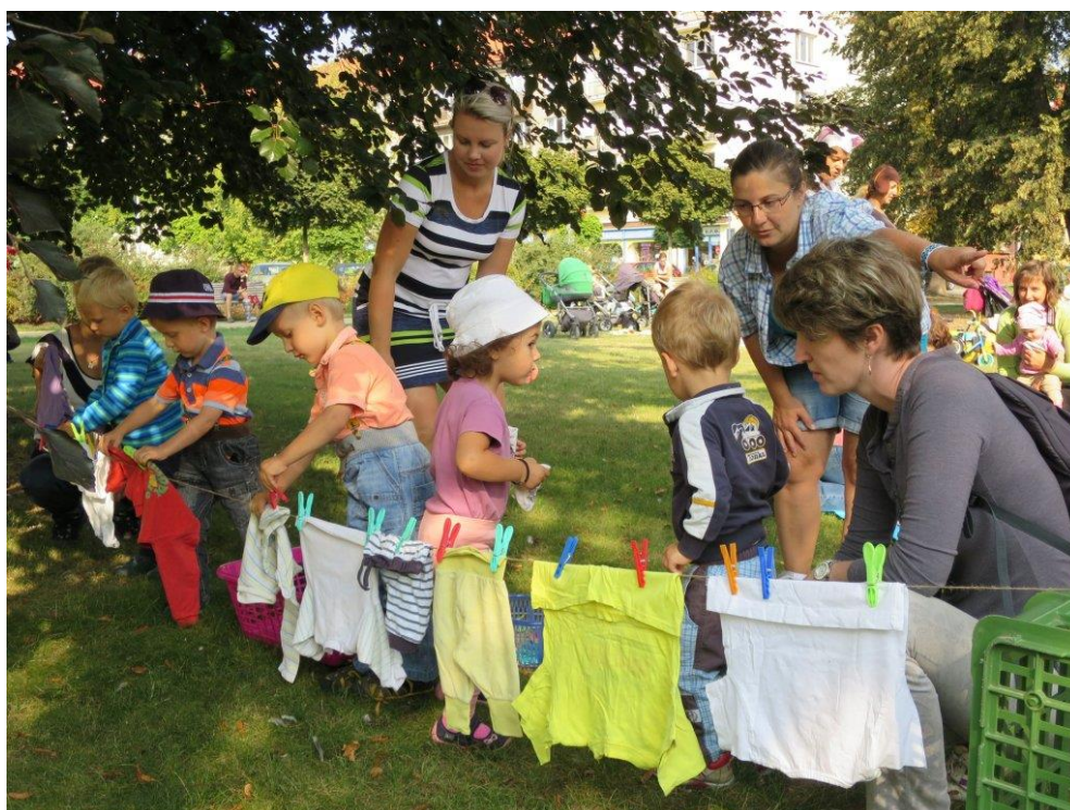
Obrázek 9 – Počteníčko v Krnově

Zárukou přímé spolupráce a pomoci jsou knihovny pověřené výkonem regionálních funkcí. Jim a především jejich pracovníkům patří poděkování za jejich práci.