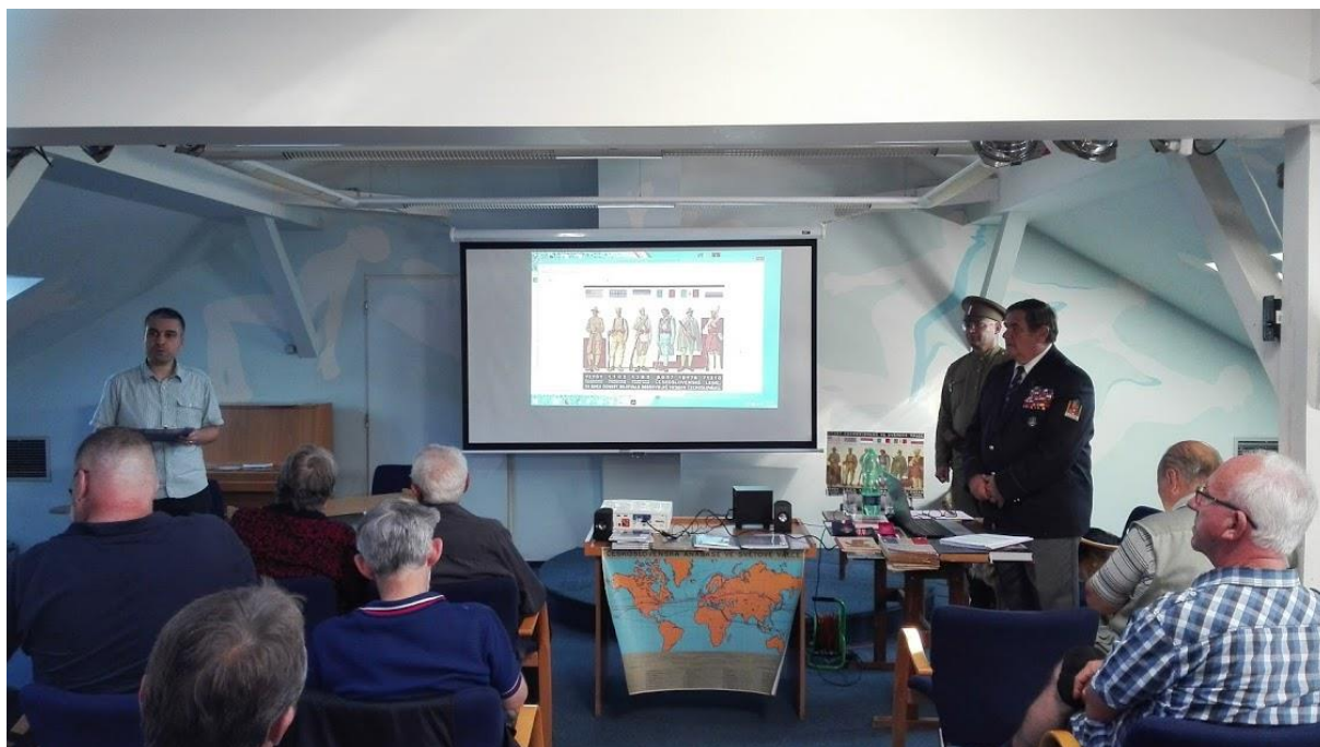
Obrázek 14 - Legionáři našeho regionu, Frýdek-Místek