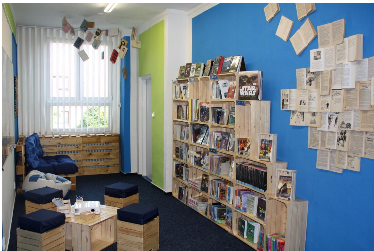
Obrázek 3 – Teen zóna v Havířově

Městská knihovna Vítkov vytvořila klidovou zónu s možností zakoupení drobného občerstvení.