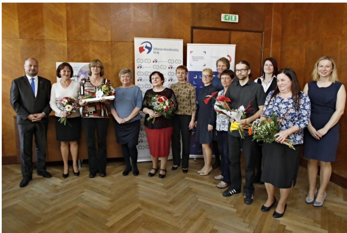
Obrázek 4 – Cena K2 2018