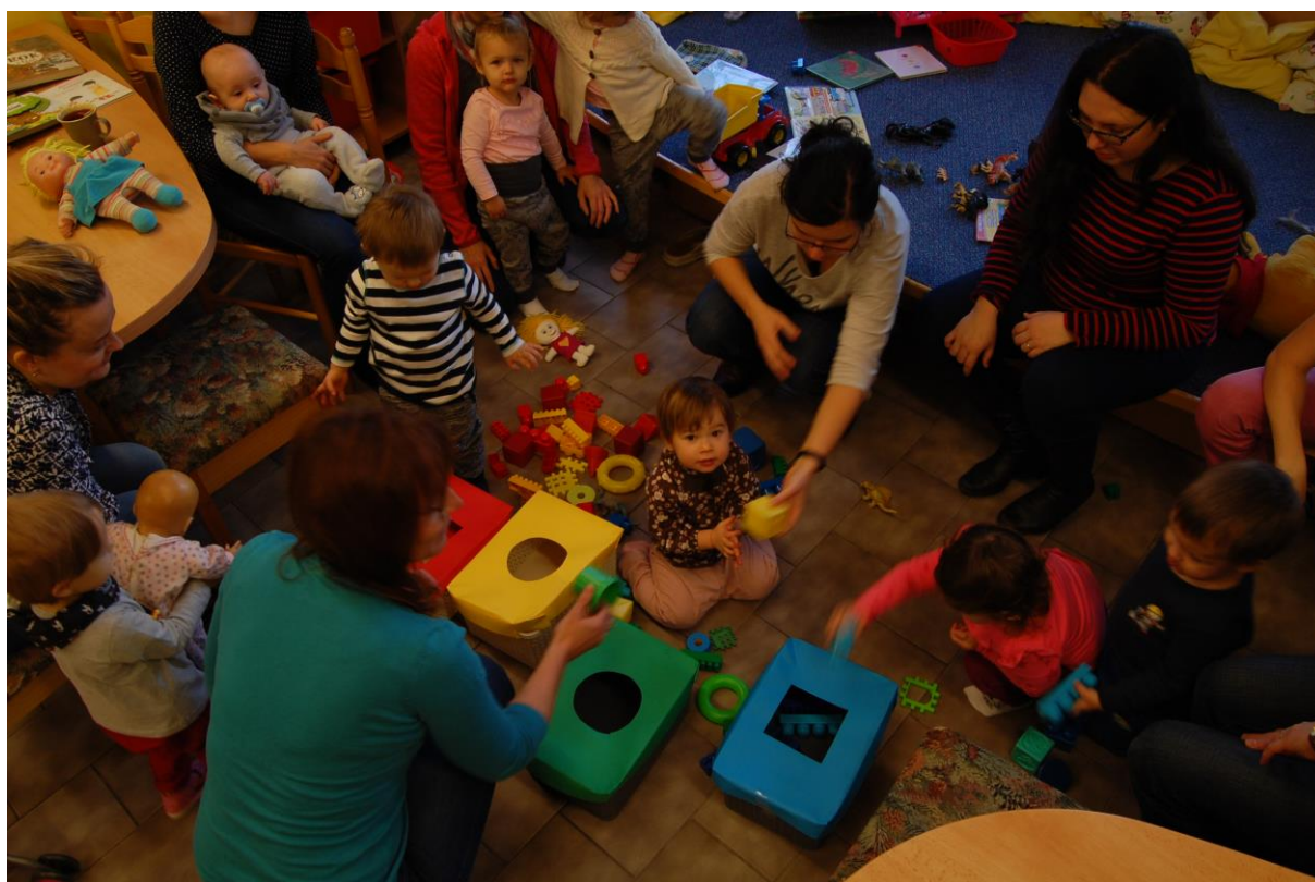
Obrázek 13 - Dětský klub ve Frýdku-Místku