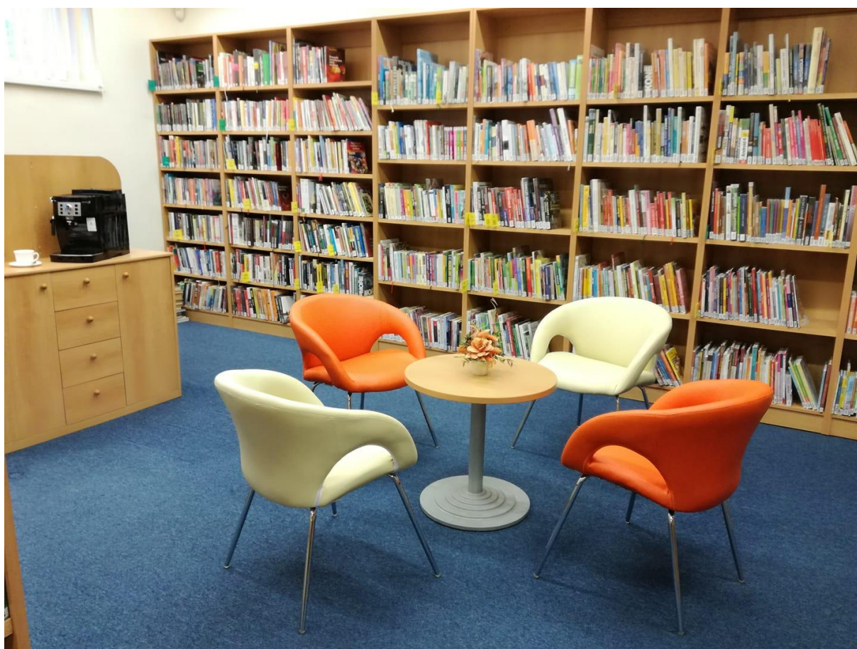
Obrázek 8 – Městská knihovna Vítkov

V roce 2018 proběhla spolupráce MěK Český Těšín se spřátelenými knihovnami na společné dětské soutěži ve tvůrčím psaní „Staň se spisovatelem s ...“ – Biblioteka Miejska w Cieszyńie (PL), Gemerská knižnica Pavla Dobšinského v Rožňavě (SK), Pučka, knjižnica i čitaonica Daruvar (HR). Vítězné práce ze všech zúčastněných knihoven jsou zveřejněny v el. sborníku.