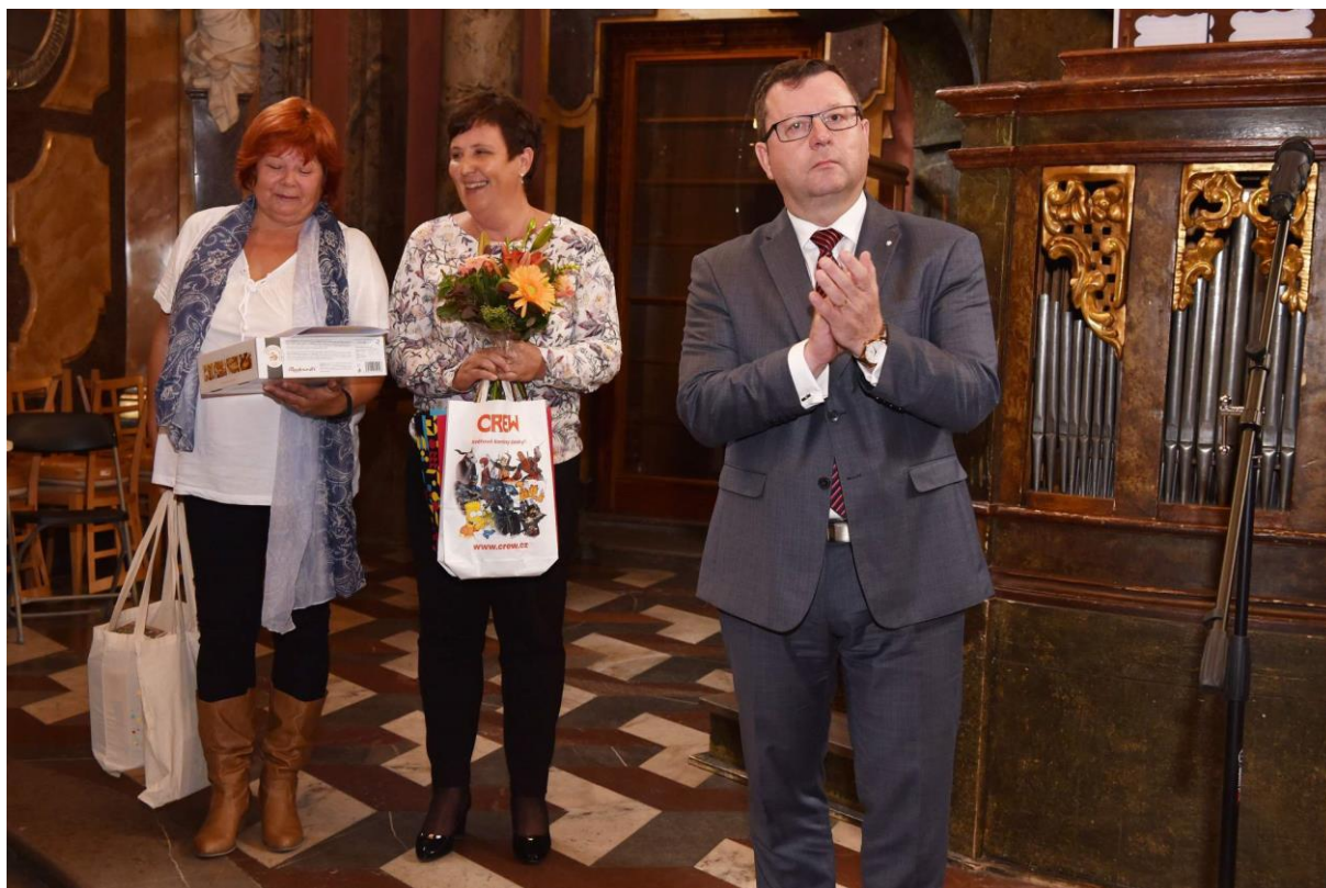
Obrázek 6 – Knihovna města Ostravy