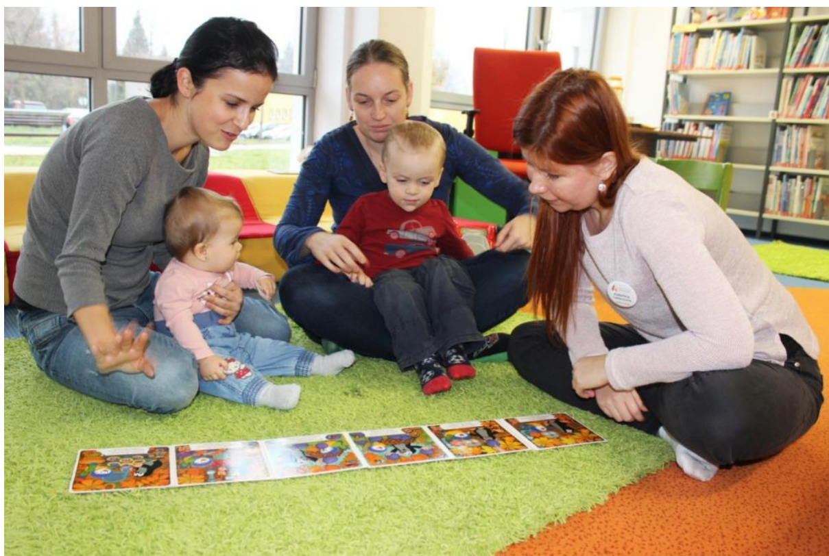
Obrázek 10 - Bookstart v Karviné