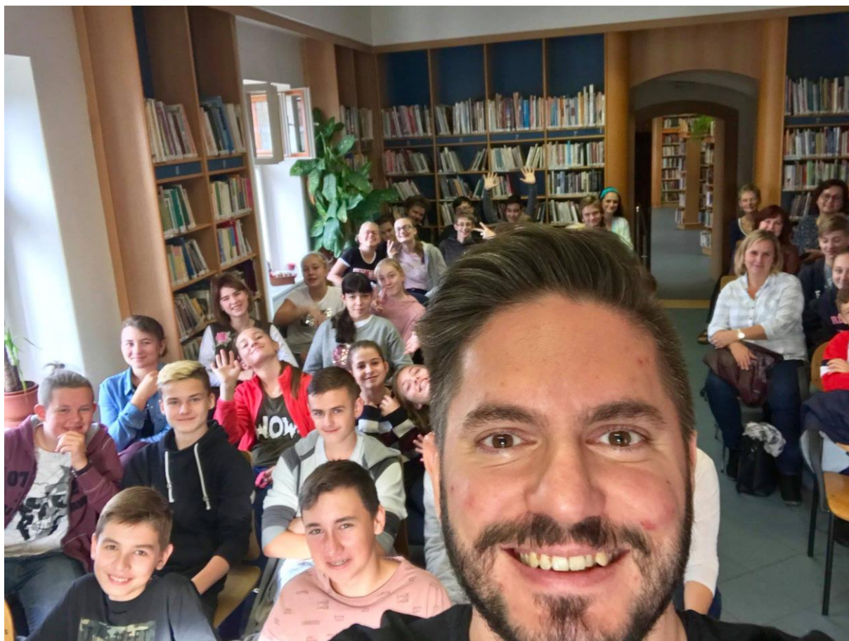
Obrázek 12 - Fake News v Brušperku