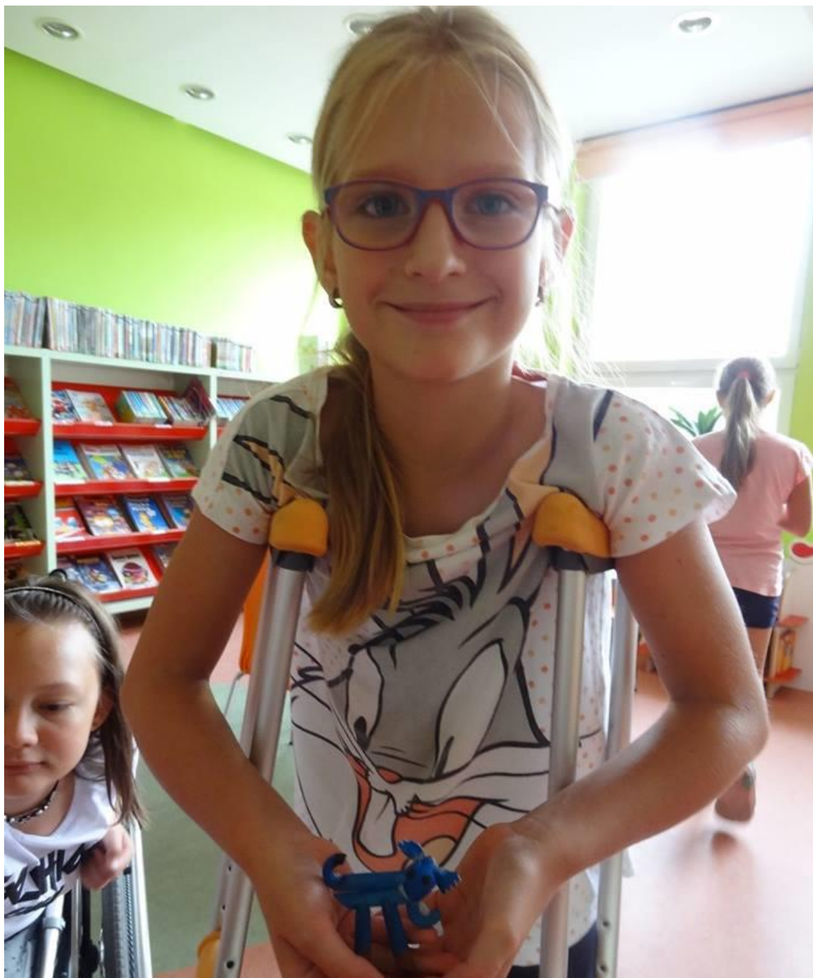
Obrázek 1 – Tvoření – Regionální knihovna Karviná

Knihovny se zapojovaly do mnoha celostátních akcí – projekt S knížkou do života (Bookstart), Lovci perel, Virtuální univerzity třetího věku (VU3V). V mnoha knihovnách byly děti prvních nebo druhých tříd pasovány na čtenáře, probíhaly akce v měsíci Březnu – měsíci čtenářů, v Týdnu knihoven, také ke Dni pro dětskou knihu, Listování, Kamarádka knihovna, Skautská pošta a Čtení pomáhá.