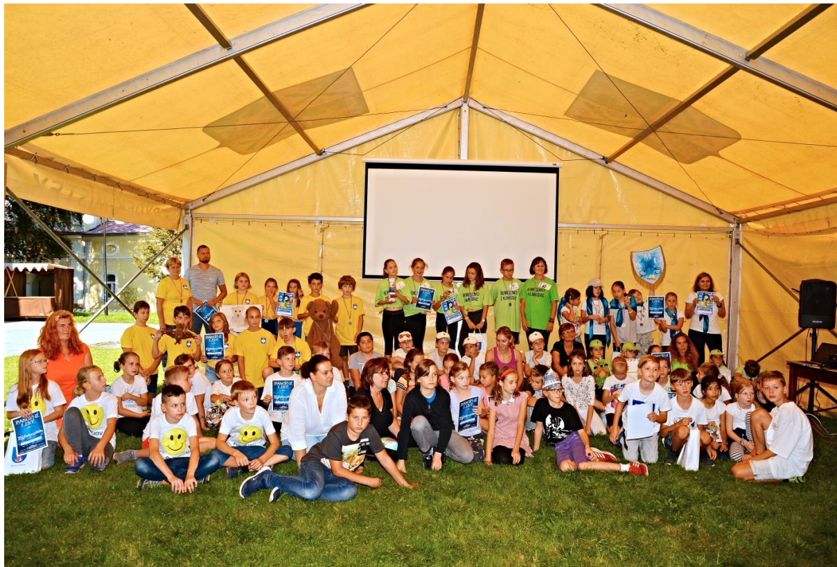
Obrázek 15 - KnihOlympiáda v Paskově